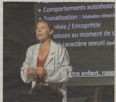
"Intimité v(i)olée, un spectacle à voir et écouter qui interroge le public et permet de bien comprendre ce phénomène des violences faites aux femmes.

Dans le cadre du second festival de théâtre de Loriol, la compagnie avignonnaise Zyane se produira sur la scène de la salle des fêtes, place du Champ-de-Mars, jeudi 6 juillet à 21 heures. La compagnie y présentera un spectacle artistique, informatif et de prévention, intitulé "Intimité v(i)olée, les violences sexuelles en mots et en scène".